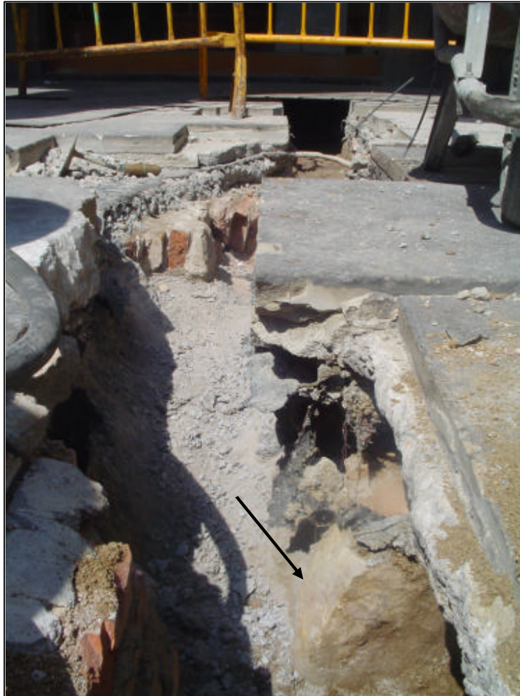
Fotografia 7: Mur UE 2003. Pertany a la trava de sustentació dels pilars del pòrtic de la Plaça Reial.