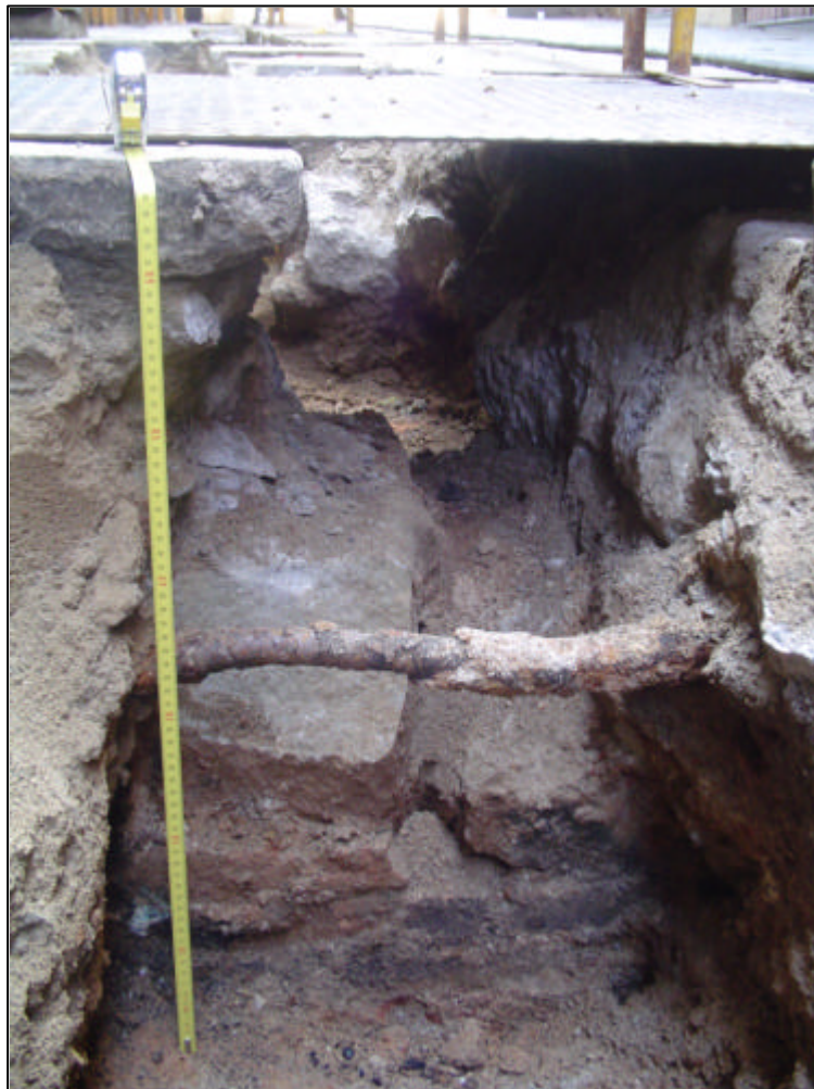
Fotografia 3: Mur UE 1003 situat al carrer del Vidre davant del núm. 6.