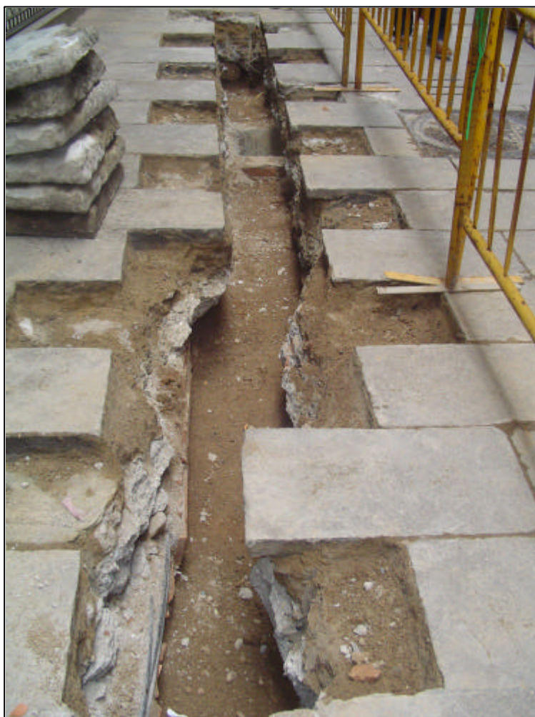
Fotografia 1: Rasa al carrer del Vidre.