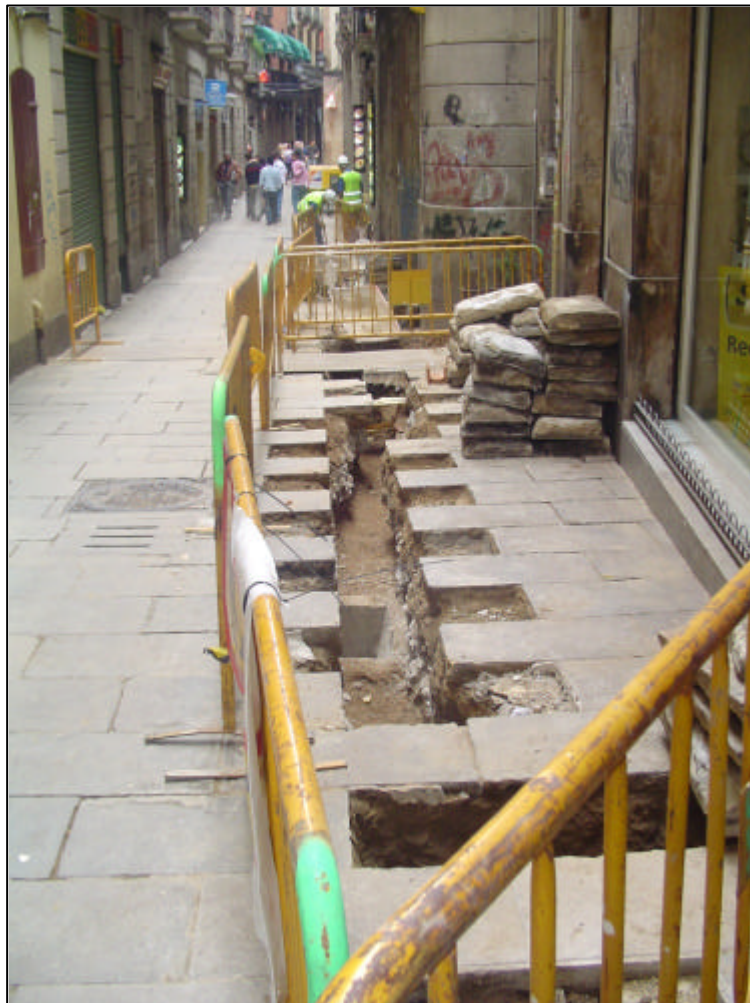
Fotografia 2: Imatge general de la rasa del carrer del Vidre realitzada des de la Plaça Reial.