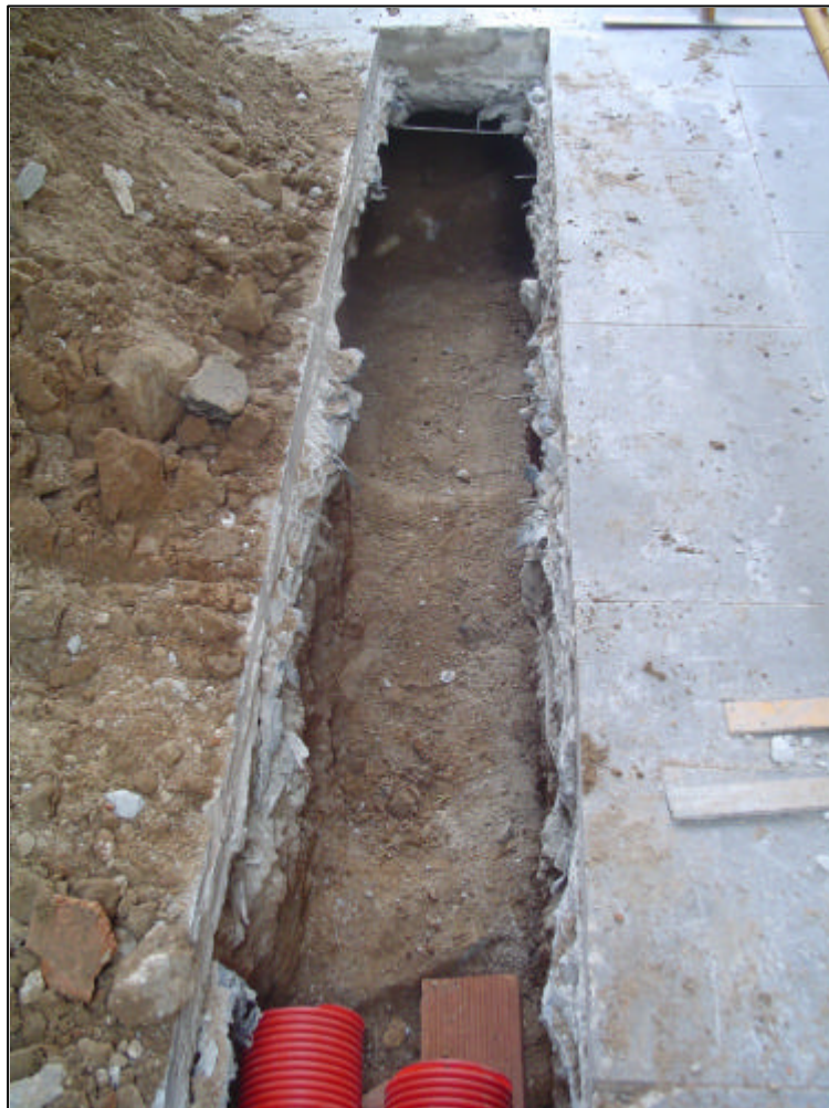
Fotografia 4: Rasa oberta a la Plaça Reial.