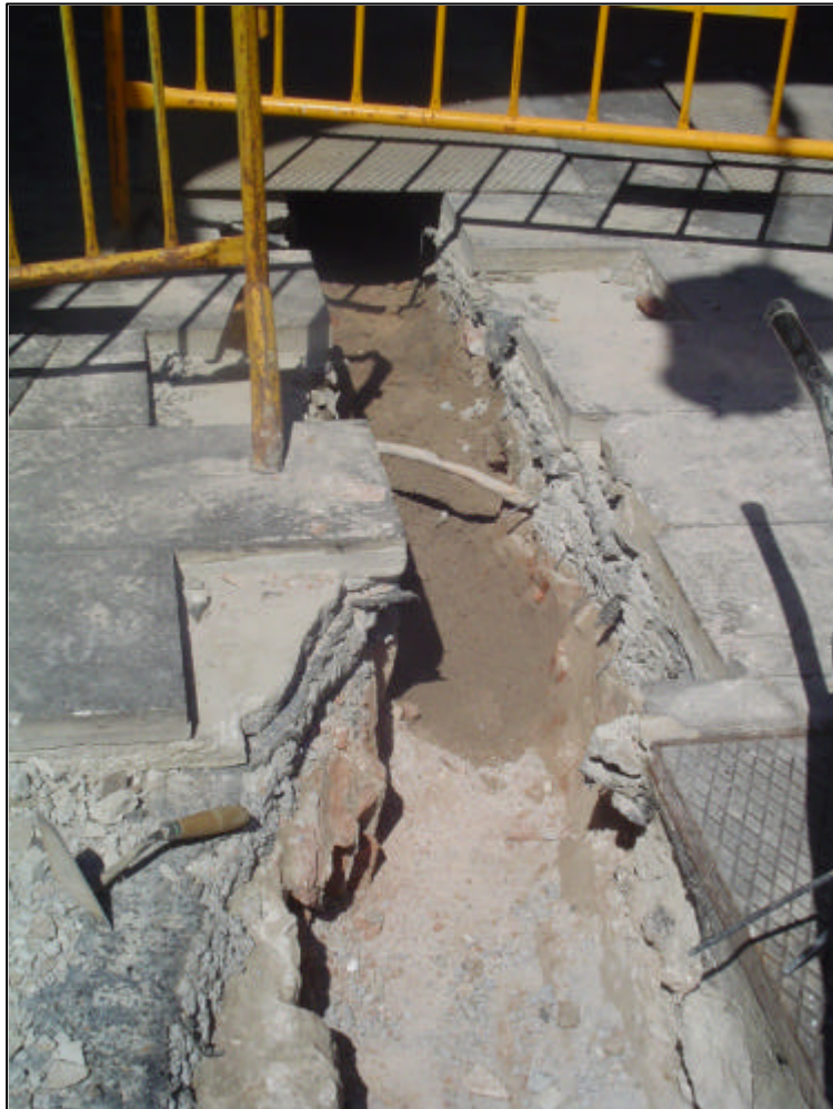
Fotografia 6: Vista de la rasa oberta al travessar la trava del pòrtic de la Plaça Reial.