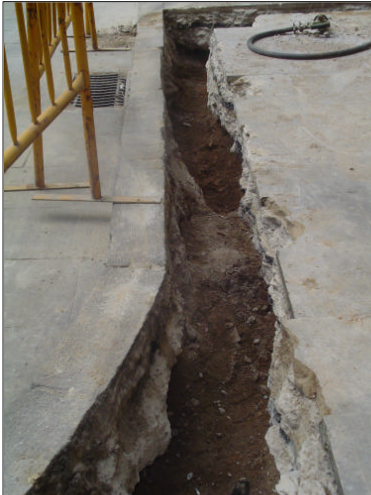
Fotografia 5: Vista del tram obert a la Plaça Reial.